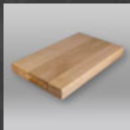
719029 Snijplank 500x300x50mm hout Joko

Om te voorkomen dat de gebruikte messen snel bot worden moet een snijplank van een zachter materiaal gemaakt zijn dan het staal van het keukenmes. Glas is om deze reden ongeschikt. De kunststof snijplanken lenen zich perfect voor het snijden en zijn vaak gemakkelijker schoon te houden. De keuze voor een houten snijplank is dan ook vaak een esthetische keuze.