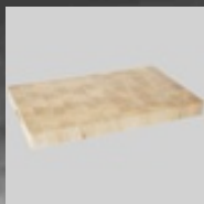
h506905 Snijplank 530x325x45 Rubberwood